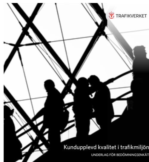
Kundupplevd kvalitet i Trafikmiljön, utveckling av utvärderingsverktyg 2015 - pågående