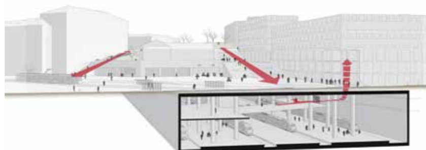
Korsvägen, Göteborg, 2015