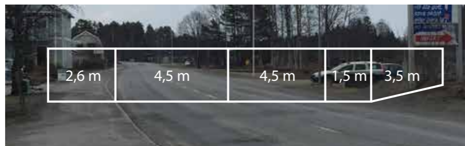
Idéskrift genomfartsmiljö, Åsarna, 2018