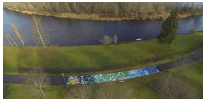
Ett av fem konstverk från Bild på Cykelväg i Karlstad, 2013