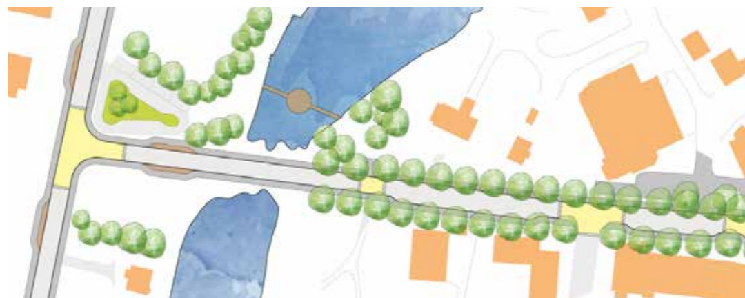
Centrumvägen/Väg 231, Svenstavik, 2017