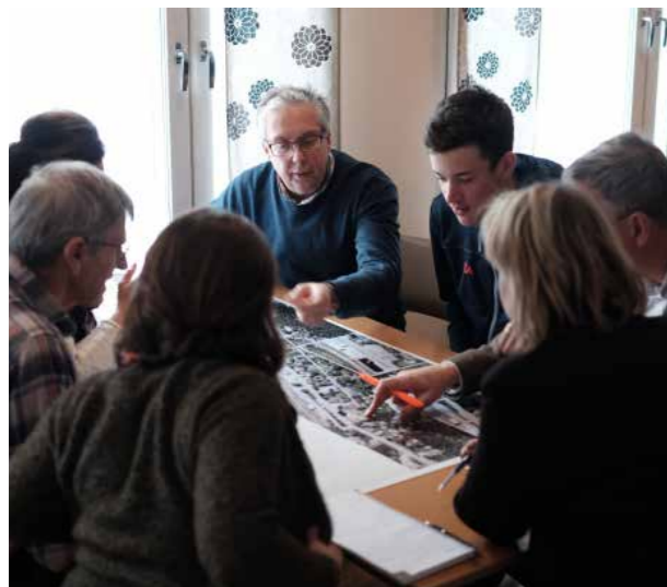
Workshop Åsarna, 2015