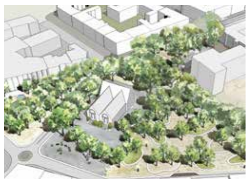
Saluhallstorget i Landskrona, 2015